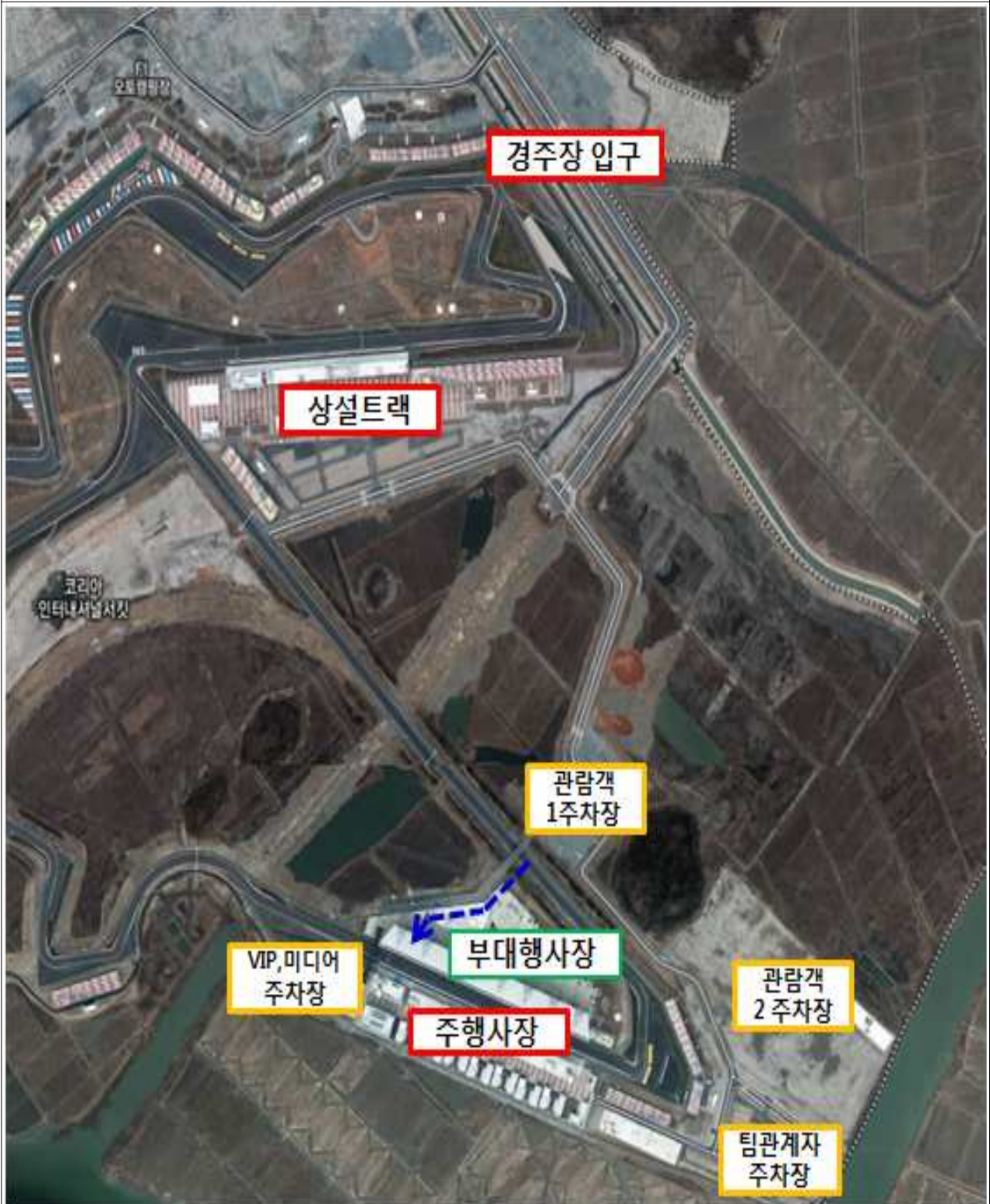
전체 행사장 안내