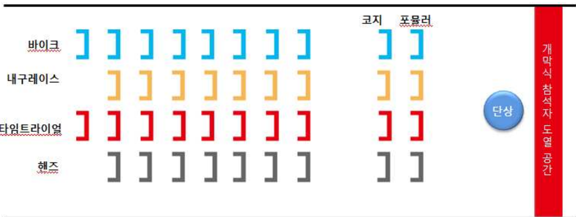
【그리드 워크 차량 도열】