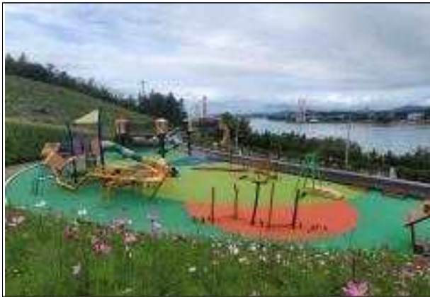
명량어린이광장 조성 완료