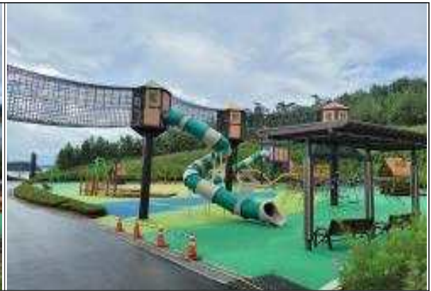
명량어린이광장 조성 완료