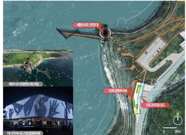
세방낙조 아트문화타워 사업구상(안)