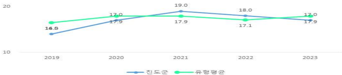
유형 지방자치단체와 사회복지비 비율 비교

우리군의 사회복지비는 전년대비 9,790백만원 증가한 99,121백만원입니다(전년대비 11%증가) 유형별로는 노인·청소년분야 62,662백만원(63.2%), 보육·가정 및 여성분야 13,404백만원(13.5%), 순입니다.