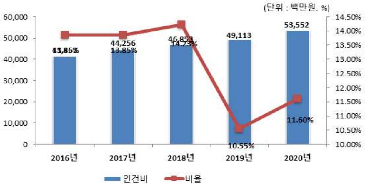
인건비 연도별 변화