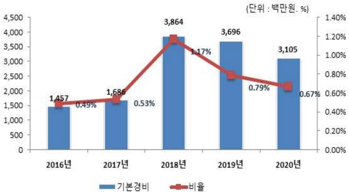
기본경비 연도별 변화